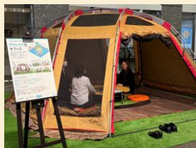
サテライトオフィス体験コーナーでは様々なオフィス形態を体験