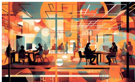
「テレワークの新形態」イメージビジュアル

2024年6月27日の第1回開催に続き、多様で柔軟な新しい働き方に向け、サテライトオフィスに関心のある企業や利用検討者を対象に、サテライトオフィス事業者との交流イベントを開催しました。