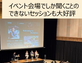
イベント会場でしか聞くことのできないセッションも大好評

サテライトオフィス利用が「生産性の向上に繋がる」と59.4%の来場者が実感！自社にあったサテライトオフィス活用術をイメージいただけました。