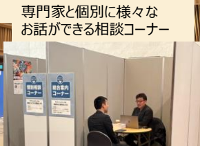
専門家と個別に様々なお話ができる相談コーナー