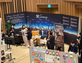
特長を全面に打ち出したブースの展示演出も見どころ